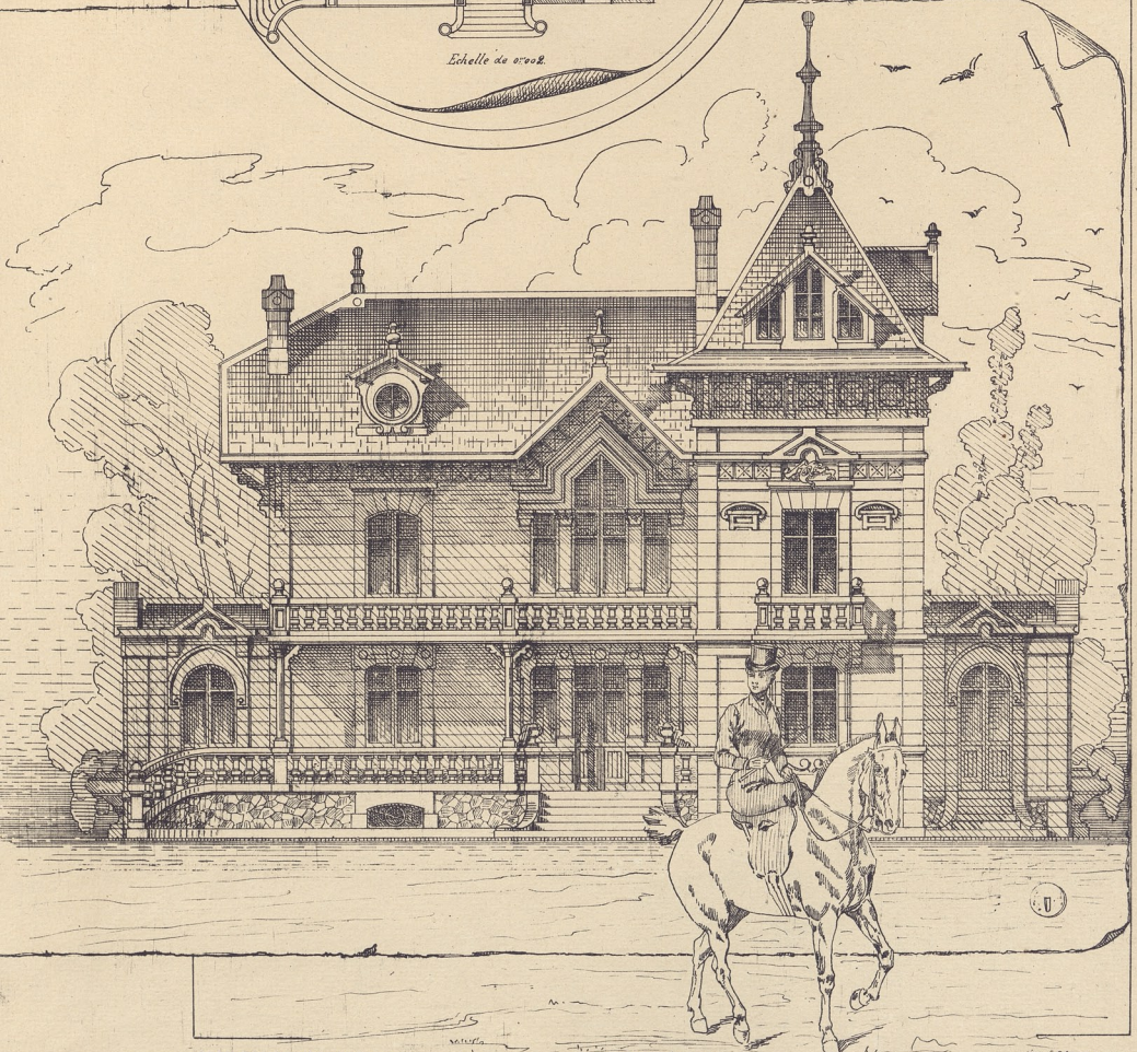
PARC DES BORIES, PRÈS BRIVE (HABITATION DE M. G. SÉGUIN)