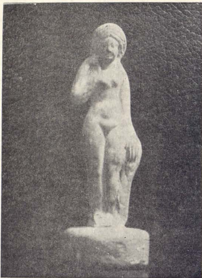
La Vénus gauloise (en terre cuite de l'Allier).