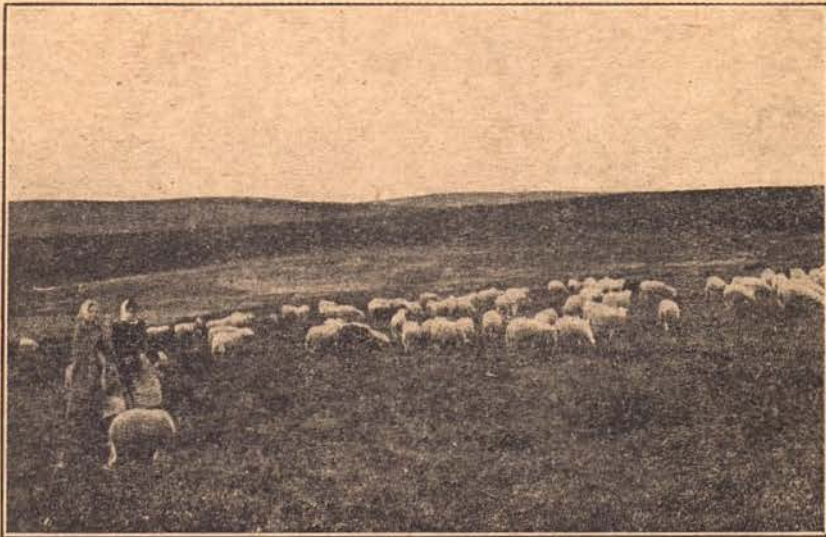
La lande autrefois sur le Plateau de Millevaches